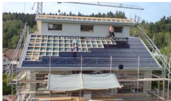
Eindeckung mit Solarmodulen