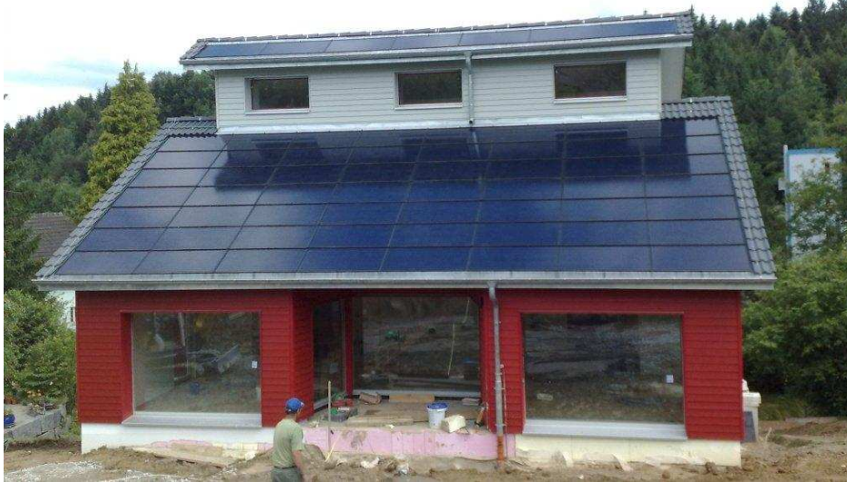
Referenzanlage Waser Holzbau AG, Oberrickenbach (Realisation durch BE Netz AG, Luzern)