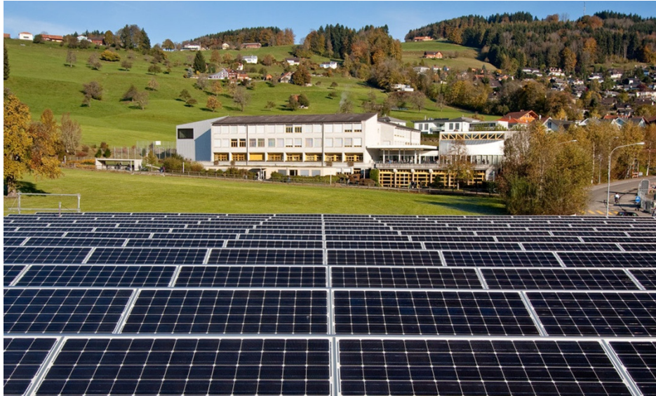
Referenzanlage Elektro Wäger & Co., Waldkirch/SG