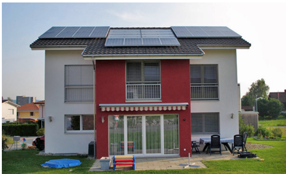
Referenzanlage Elektro Wäger & Co., Waldkirch/SG