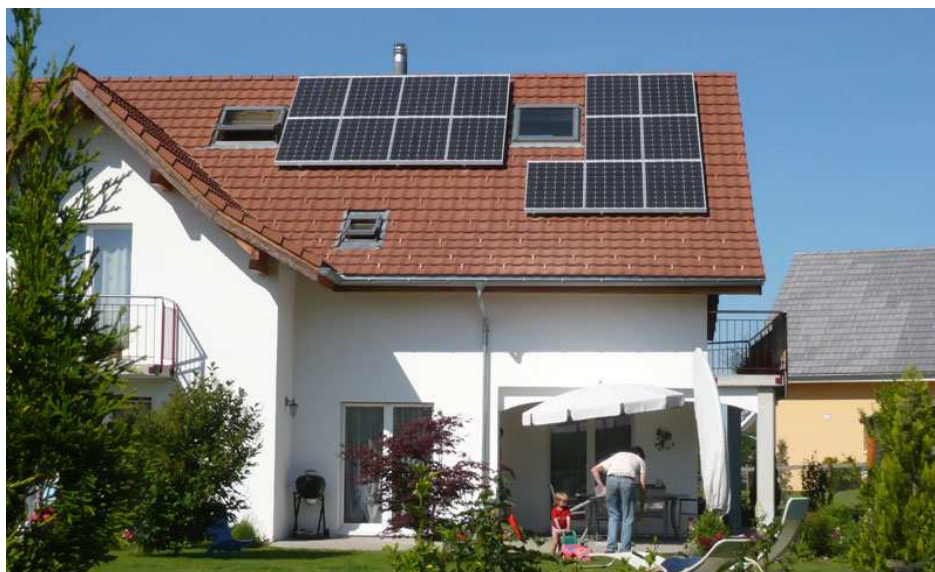
Referenzanlage Elektro Wäger & Co., Waldkirch/SG