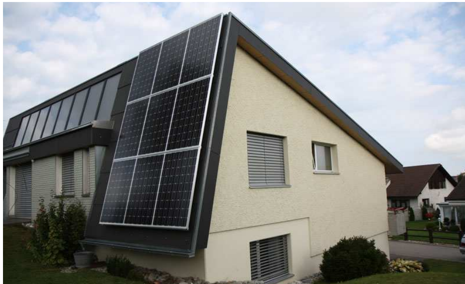
Referenzanlage Elektro Wäger & Co., Waldkirch/SG