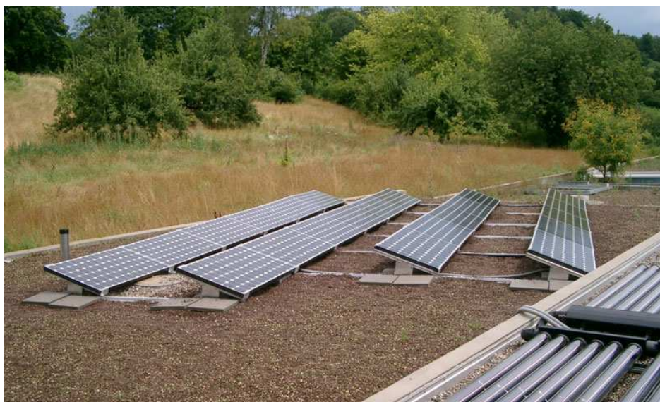
Referenzanlage Elektro Wäger & Co., Waldkirch/SG