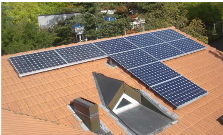
Referenzanlage Eugen Stocker AG, Küssnacht a/Rigi