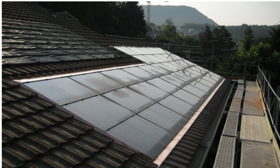
Referenzanlage Willy Gysin AG, Liestal /BL